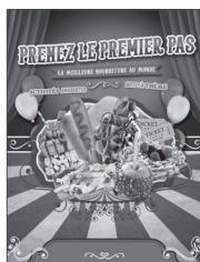
MINI AFFICHE 8,5 po X 11 po

Veuillez visiter la section Modèles de marketing du lien Promotions sur Sodexo Net pour obtenir une variété d'outils supplémentaires que vous pouvez utiliser pour promouvoir la promotion PRENEZ LE PREMIER PAS . Disponible sur la page Compètes canadiens .